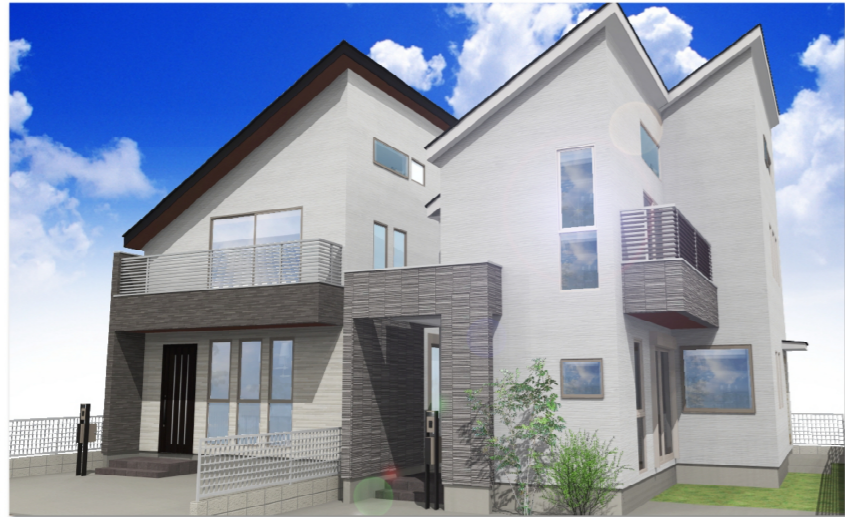
号棟イメージパース